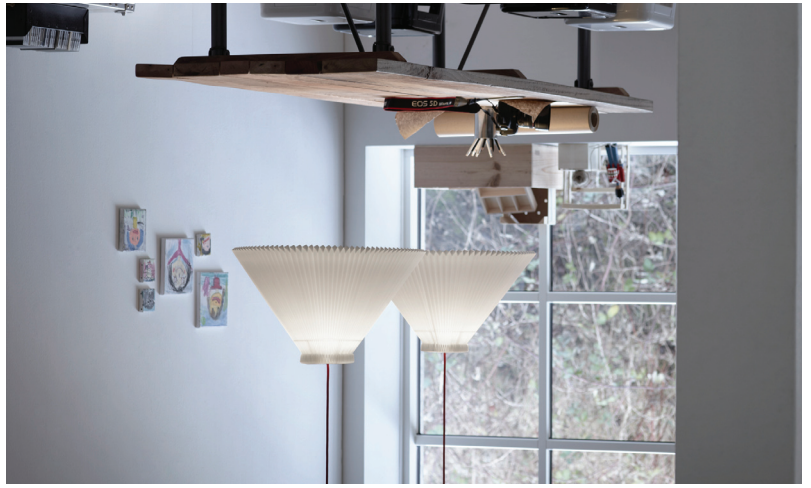
Den klassiske model 1, designed af Tage Klint i 1942. The Classic model 1, designed by Tage Klint in 1942.

Tage Klint added the unique collar to the original Klint lampshades, which exploits the elasticity in the material, allowing the shade to fit firmly in place on a stand. Tage Klint also designed a number of lamps, of which some are still part of the LE KLINT product range.