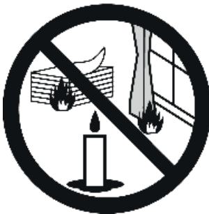
Keep away from combustibles

Ingo Maurer GmbH accepts no liability for damage.