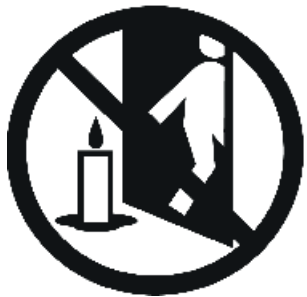
Burn within sight