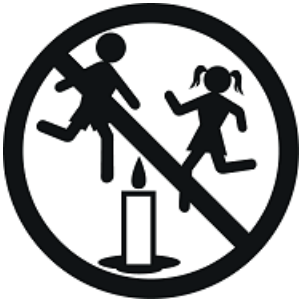
Keep away from children

Despite using top-grade materials and enforcing high manufacturing standards, we cannot rule out the possibility of flaws causing the suspension wire to burn through or break.